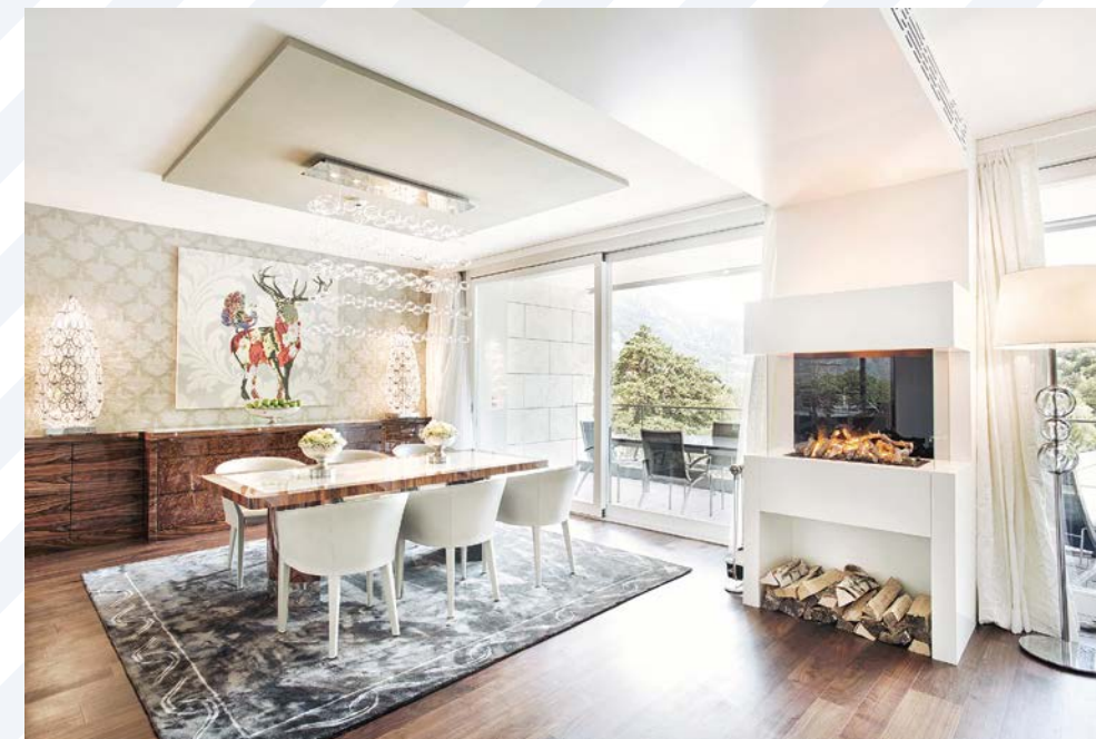
Spa Suites, Presidential Suite | © Grand Resort Bad Ragaz linke Seite | Grand Hotel Quellenhof | beide © Grand Resort Bad Ragaz

Die Geschichte des Grand Resort Bad Ragaz ist eine lange und sehr bewegende. Das zeigt auch die neu konzipierte Ausstellung anlässlich des 150-Jahr-Jubiläums des Grand Hotel Quellenhof. Was vor 777 Jahren in der Taminaschlucht seinen Anfang nahm, feiert 2019 seinen runden Geburtstag. Seit rund 150 Jahren zählt das Grand Hotel Quellenhof als Teil des Grand Resort Bad Ragaz zu den führenden „Wellbeing & Medical Health Resorts“ in Europa. Ob Staatsmänner, Filmstars oder Mitglieder von Königshäusern, sie alle gehören zu den regelmäßig wiederkehrenden Gästen und erkoren das Fünf-Sterne-Haus in Bad Ragaz mit seinen 98 luxuriösen Suiten zum Aushängeschild der Schweizer Spitzenhotellerie. Seit 1. Juli 2019 präsentiert sich die „Grande Dame“ nach fünfmonatigem Umbau in neuem, modernem Kleid und läutet eine neue Ära der Luxushotellerie ein.